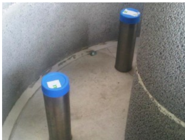
Particolare interno impianto

L'impianto ViaPlus 3000 è dimensionato per superfici connesse fino a massimo 3000 mq e flusso in pari a 0,010 l/s/m 2 .